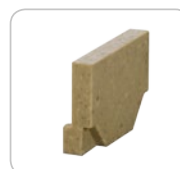
Ścianka czołowa bez wyjścia