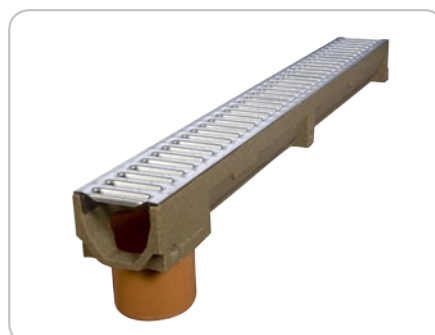
kanał HOME B=100 H=90 z króćcem