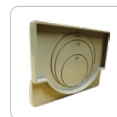
* Ścianka uniwersalna z PE