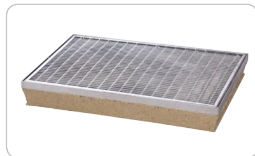
Wycieraczka z rusztem kratowym