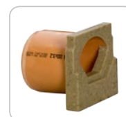
Ścianka czołowa z króćcem