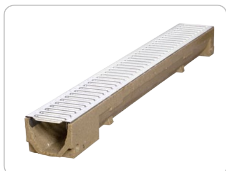
kanał HOME B=100 H=90 standard

* w jednym opakowaniu połowa ilości kanałów posiada możliwość wybicia otworu w dnie