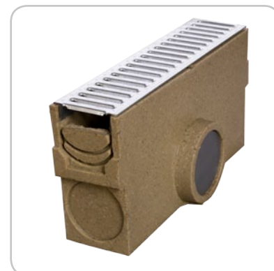
Osadnik + kuweta + ruszt ocynkowany